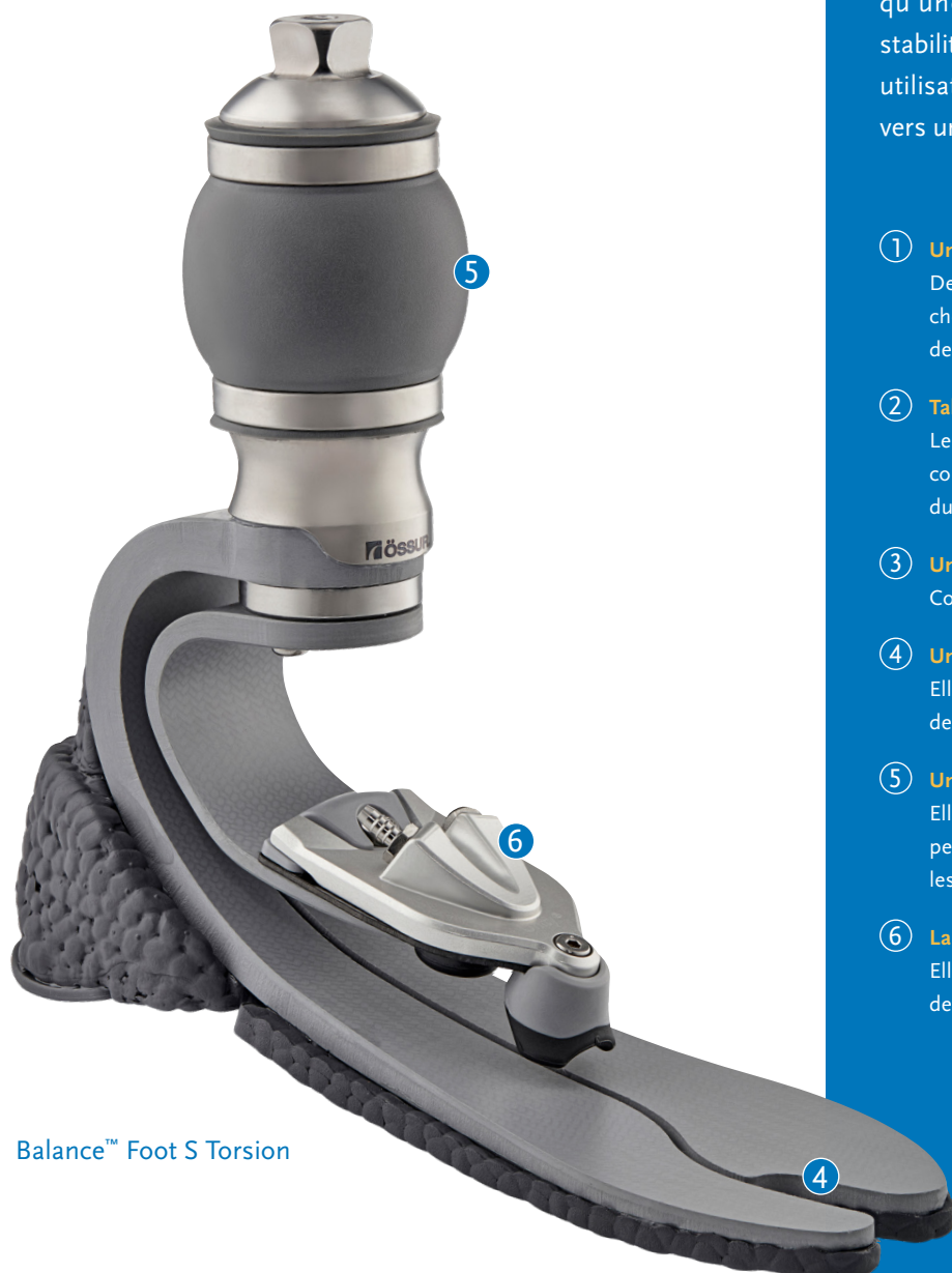
Balance™ Foot S Torsion