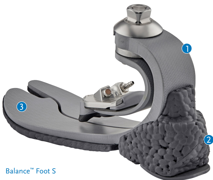
Balance™ Foot S

Découvrez le pied Balance Foot S . Il combine un talon souple amortissant les chocs, une forme unique en C, une lame plantaire large et fendue ainsi qu'une unité de torsion optionnelle. Il offre la stabilité, la sécurité et l'assurance que requièrent les utilisateurs faiblement actifs, en les accompagnant vers une expérience de marche d'un nouveau niveau.