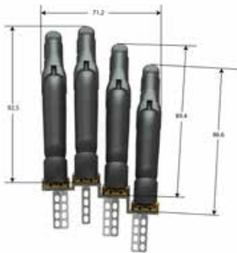
Placa de montaje XS: posición derecha de dígito