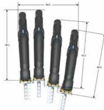
Placa de montaje M: posición extendida de dígito