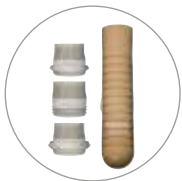
썰-인 X TF 라이너