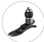
프로-플렉스 LP 토션