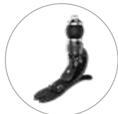
프로-플렉스 XC 토션