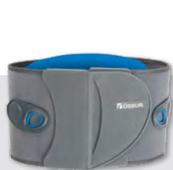
Miami LSO™ Light