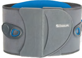
Miami LSO™ Light

Die Rückenorthesen Miami LSO™ Light und Miami LSO™ sind für zahlreiche Indikationen im Einsatz – immer mit dem Ziel, eine dauerhafte Stabilisierung, Entlastung und Schmerzlinderung zu erreichen.