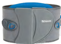
Miami LSO™ Light